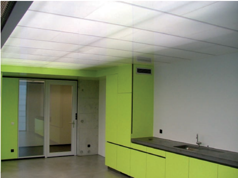
Pausenraum: Transparente Akustikdecke MA93 43 hinterleuchtet.