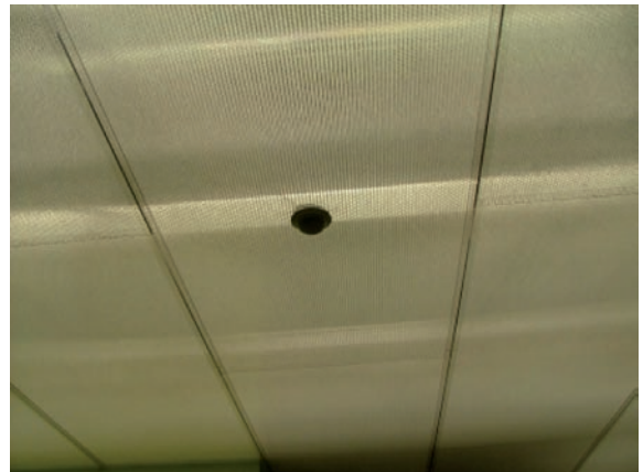
Ausschnitt der transparenten Akustikdecke. Auf transparente H-Profile aufgelegt. Einbau von Feuermelder.

Der Trend zeitgenössischer Architektur geht zu immer mehr Glas. Das Streben nach Transparenz und Licht muss nicht im Widerspruch zur Akustik stehen